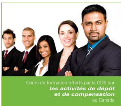
Cours de formation offerts par la CDS sur les activités de dépôt et de compensation au Canada

La CDS s'emploie depuis de nombreuses années à faire connaître aux délégations internationales les rouages du système de dépôt du Canada. En octobre 2009, elle a offert pour la première fois des cours qui s'adressent directement aux intervenants du marché. À la lumière des commentaires abondants qu'elle a recueillis à la suite des cours pilotes sur la compensation et le règlement d'opérations ainsi que sur le traitement effectué par les services de dépôt, la CDS propose un éventail plus étendu de cinq cours d'une journée qui commenceront en avril 2010.